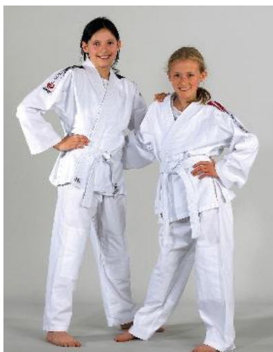
Judogis pour enfants

Renforcements aux genoux et aux épaules 100% COTON (180 gr/m 2 ) Pantalon élastique